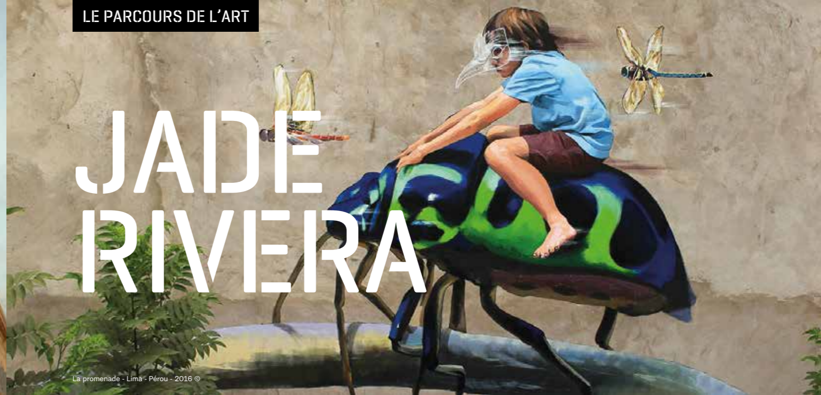
La promenade - Lima - Pérou - 2016 ©

Jade Rivera est un artiste urbain péruvien dont le travail, des pièces miniatures aux grandes fresques murales, frappe par la sincérité avec laquelle l'artiste décrit les réalités qui l'entourent, les problèmes auxquels les gens sont confrontés au Pérou et le lien profond qu'ils ont avec leur propre culture.