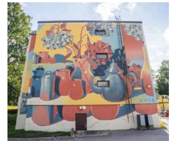
Vantaa - Finlande - 2017 ©