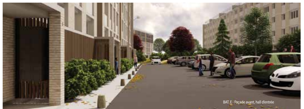
BAT. E - Façade avant, hall d'entrée