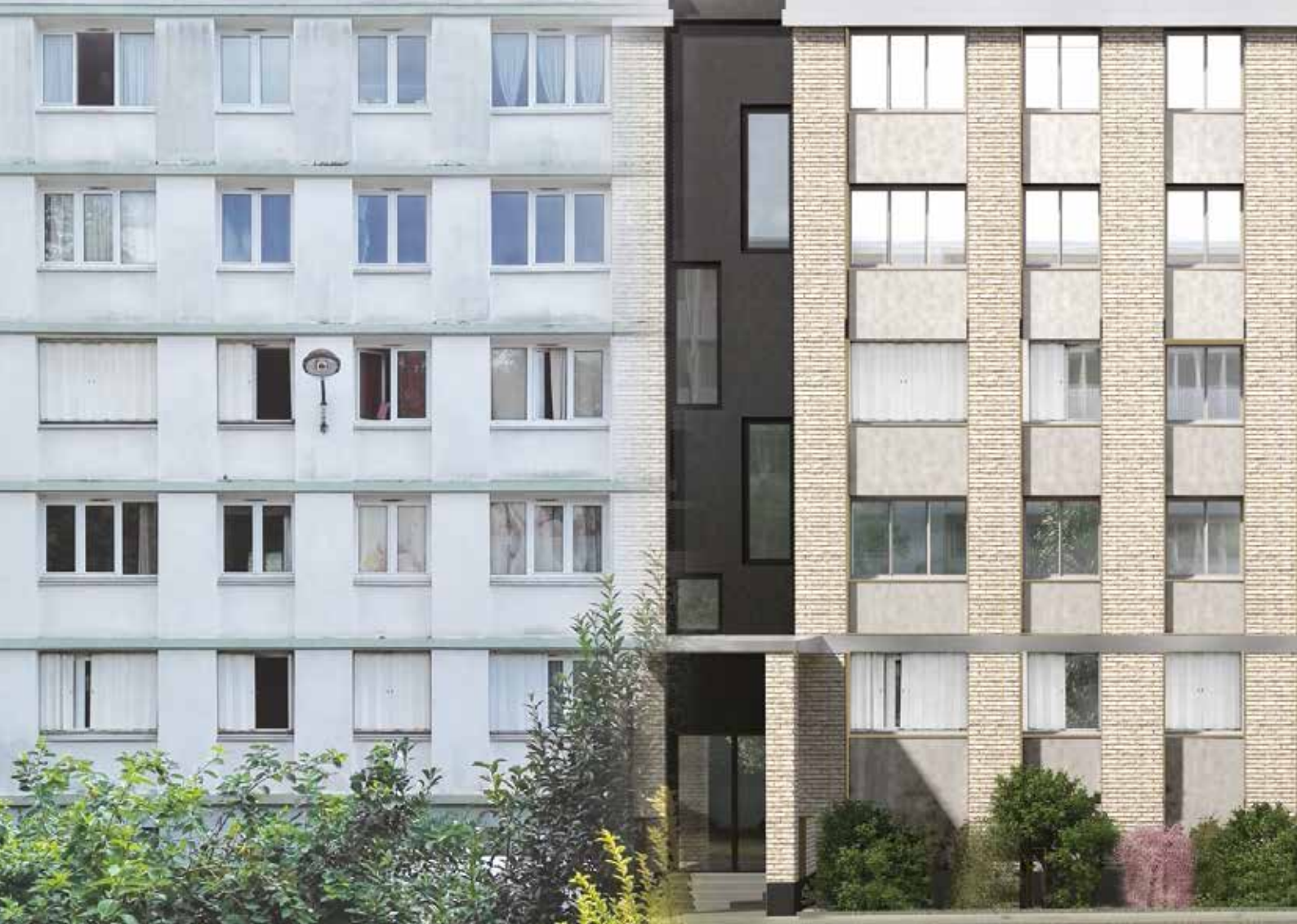
Quartier Bernard de Jussieu, projet de réhabilitation avant/après (bâtiments O, P, Q et R) © VLAU