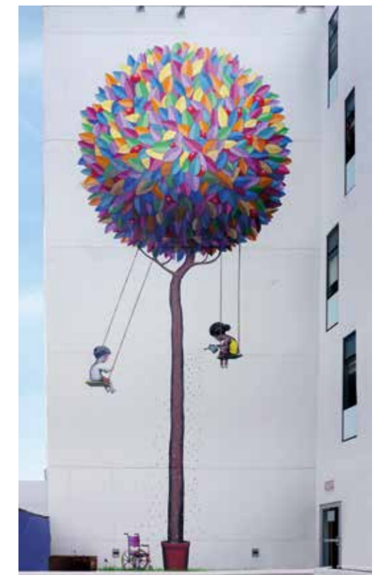
Les jardiniers - Miami - Etats-Unis - 2018