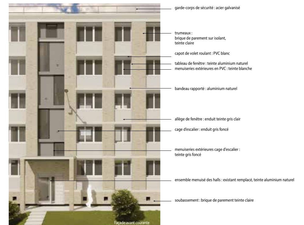
Façade avant courante