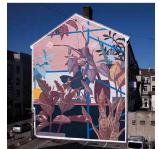
Zone grise n. 1 - Oslo - Norvège - 2018 ©