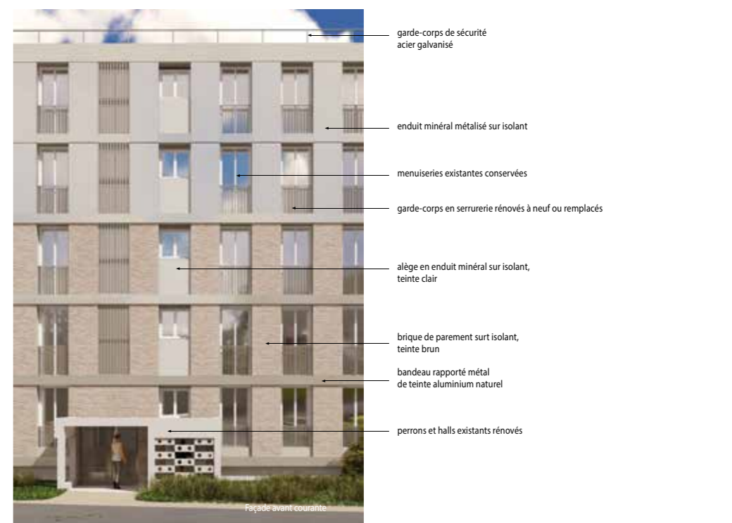
Façade avant courante