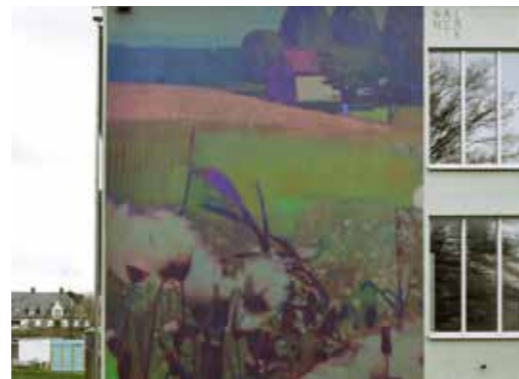
Les Basses Carpates - Ostende - Belgique - 2018 ©