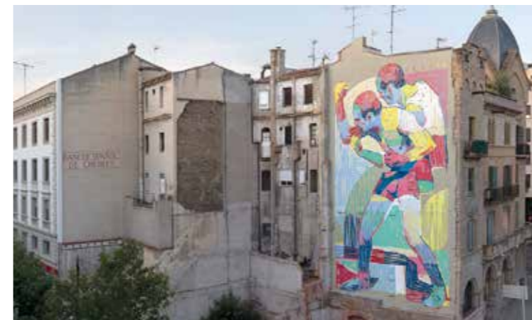
Manresa - Espagne - 2018 ©

Aryz préfère créer des fresques aux personnages monumentaux sans se concentrer sur un message spécifique. Il est connu pour l'utilisation de techniques mixtes et de styles de peinture différents, son art possédant des couleurs vibrantes et des atmosphères fantastiques ressemblant à celles de la science-fiction. Généralement, les peintures d'Aryz représentent des humains ou des animaux de couleurs surréalistes et pastels, jouant entre surréalisme et Pop Art.