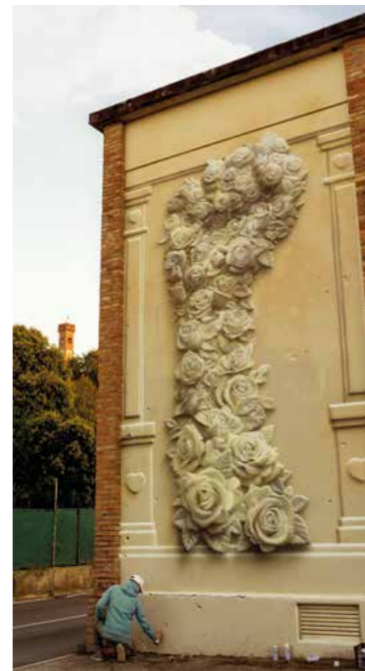
La tour du peuple - Santarcangelo di Romagna - Italie - 2018