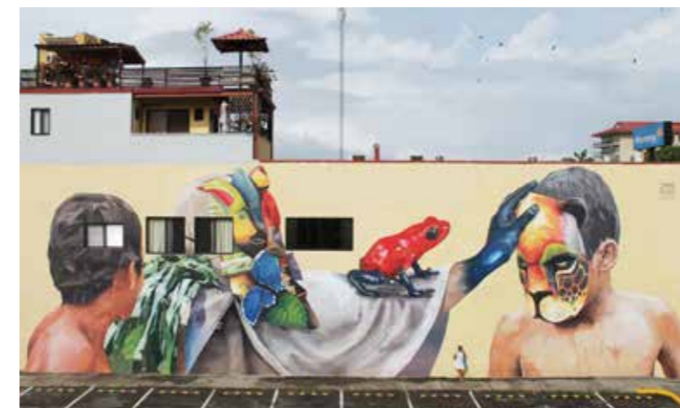
Héritage - Jacó - Costa Rica - 2017 ©