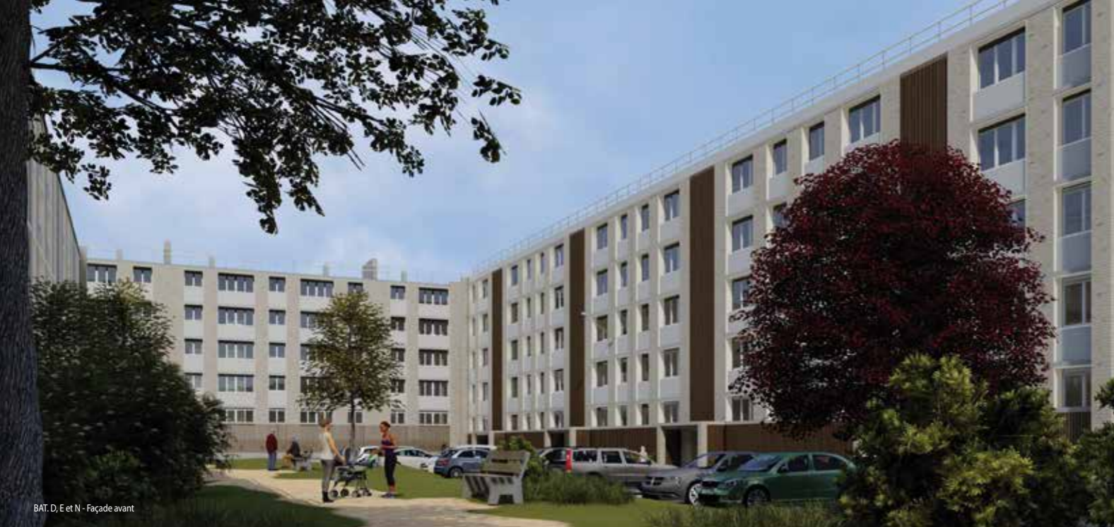
BAT. D, E et N - Façade avant