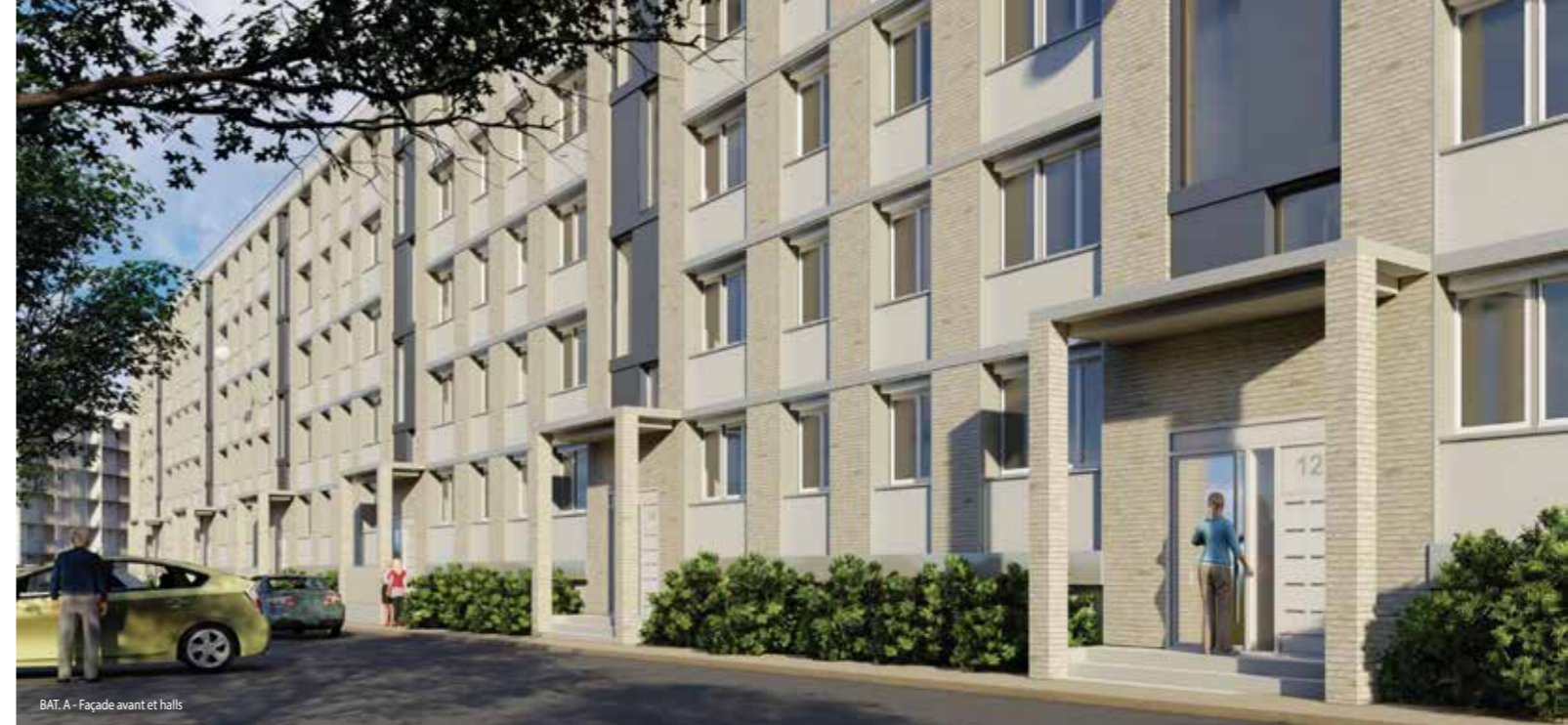
BAT. A - Façade avant et halls

1er trimestre 2021 : Réception des travaux – 3 ème et 4 ème tranches