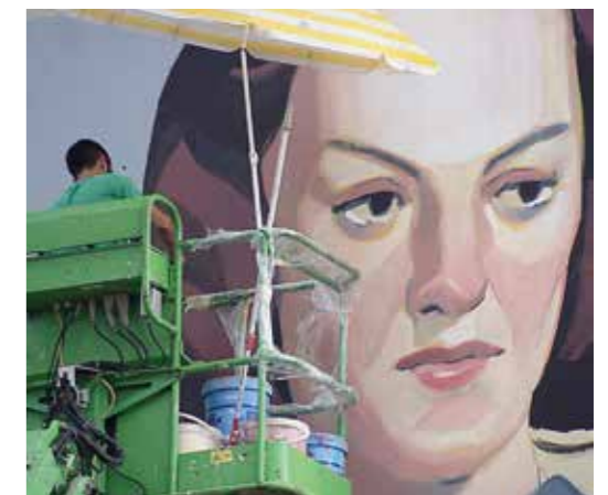
Toulouse - France - 2016 ©