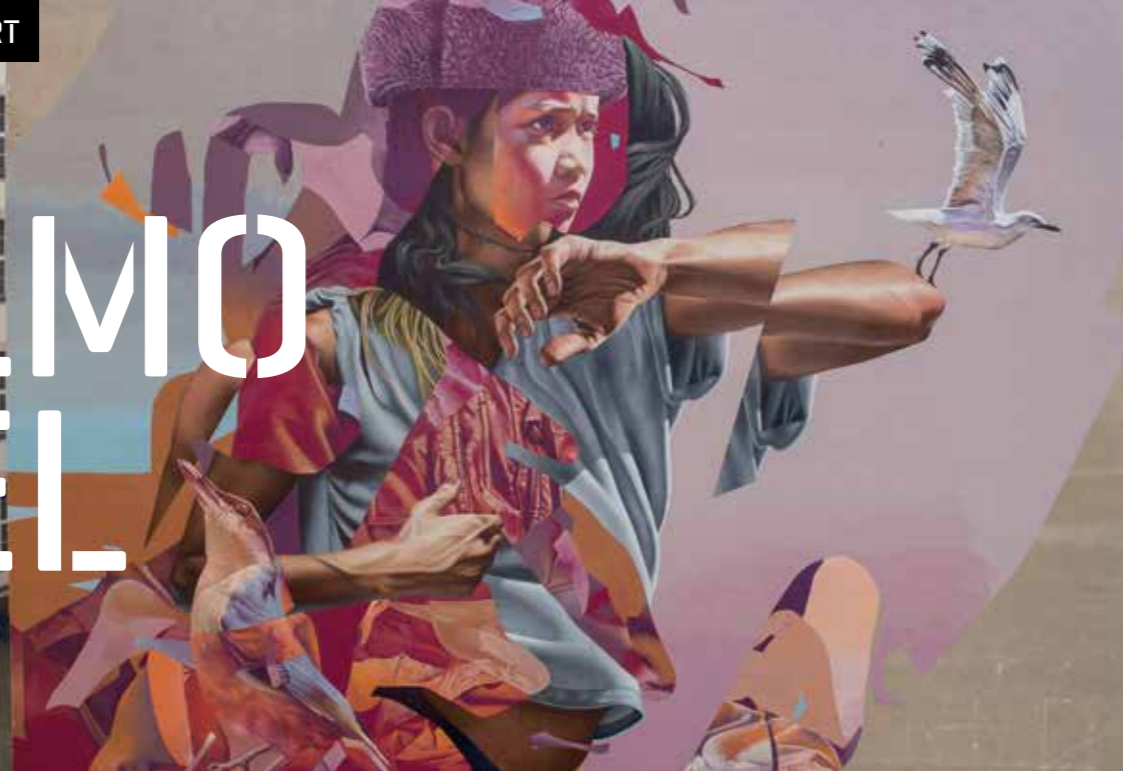
Après coup - Allemagne ©