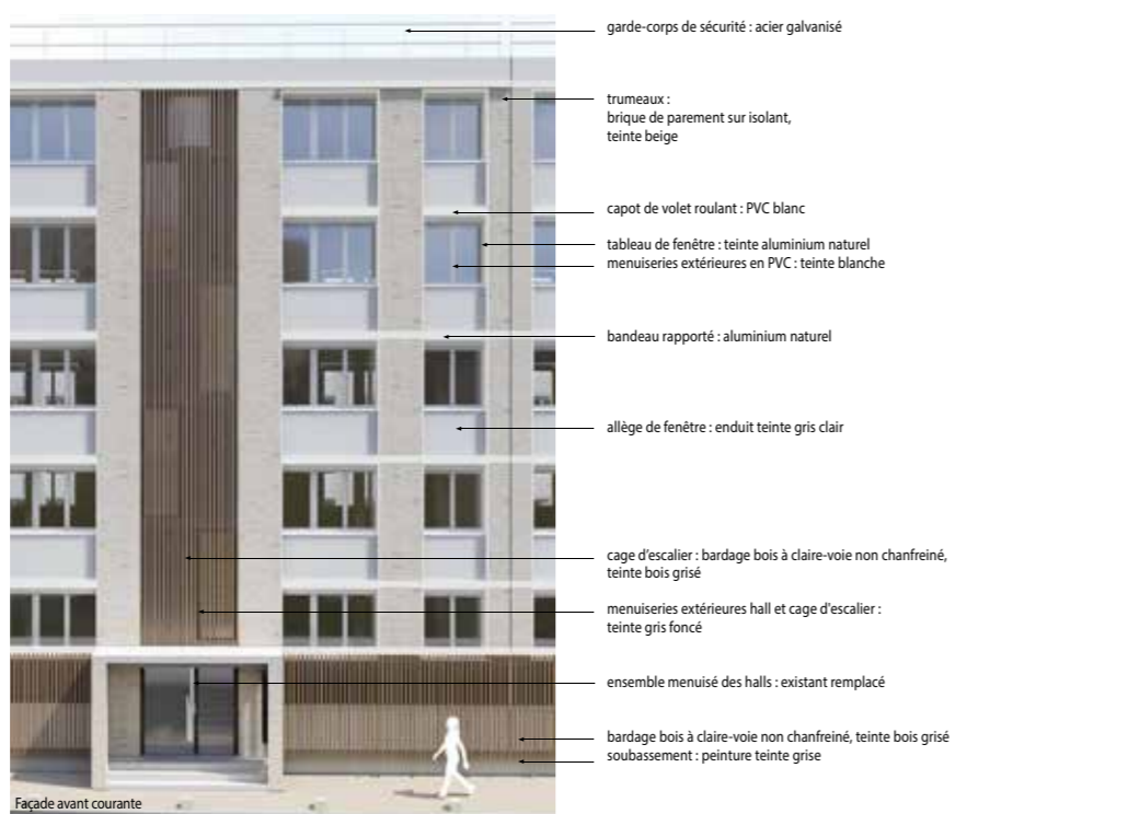
Façade avant courante

garde-corps de sécurité : acier galvanisé