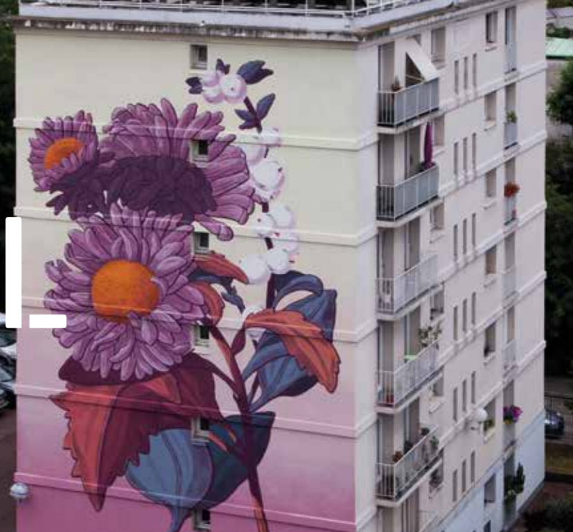
Aster et Symphorine - Paris - France - 2017 ©

Mona Caron est une artiste née en Suisse et basée à San Francisco, utilisant le muralisme, l'illustration et la photographie dans son art et son "artivisme". Elle met l'accent sur les fresques murales à caractère communautaire et propres à chaque site dans l'espace public. Mona a réalisé des fresques murales à grande échelle aux Etats-Unis, en Europe, en Amérique du Sud et en Asie.