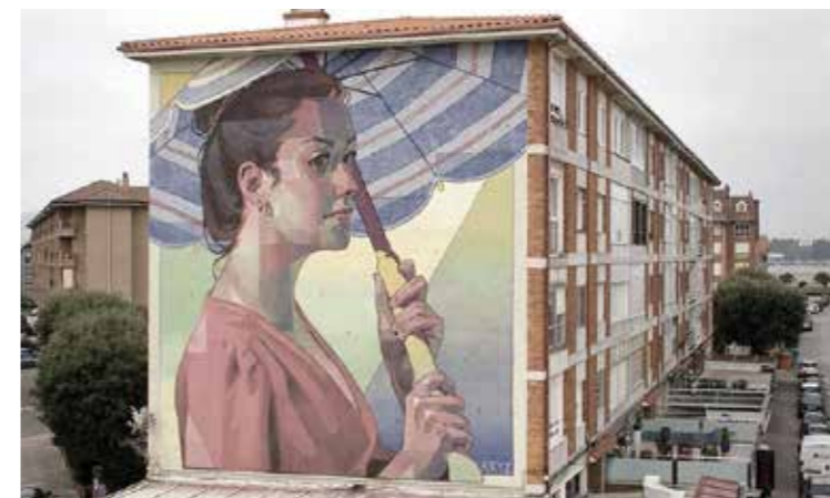
Somo - Cantabria - 2017 ©