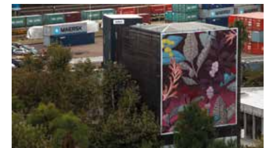
Peau de serpent - Buenos Aires - Argentine - 2016