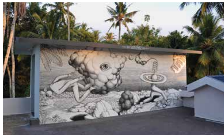
Matière changement d'état - Delhi - Inde - 2016