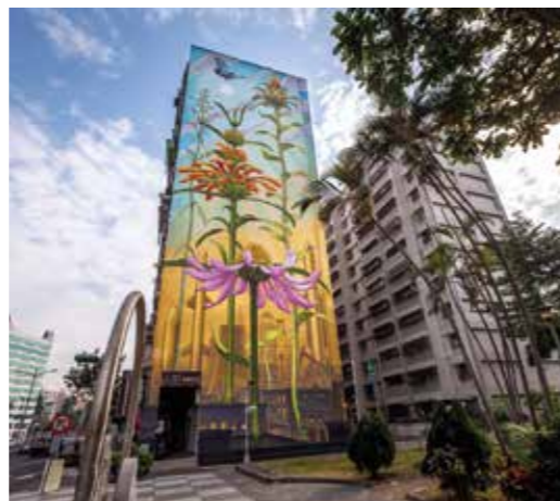
Grandissant - Kaohsiung - Taiwan - 2017 ©