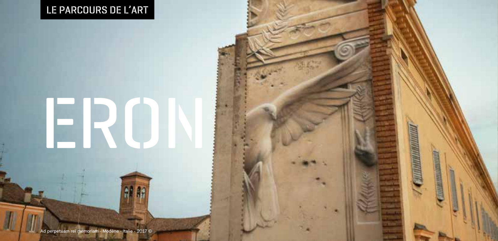
Ad perpetuam rei memoriam - Modène - Italie - 2017 ©

Eron est le pseudonyme d'un artiste contemporain originaire de Rome qui a développé un style unique et original particulièrement étonnant. Le travail de l'un des représentants les plus connus du graffiti et des arts de la rue italiens touche souvent à des questions sociales.