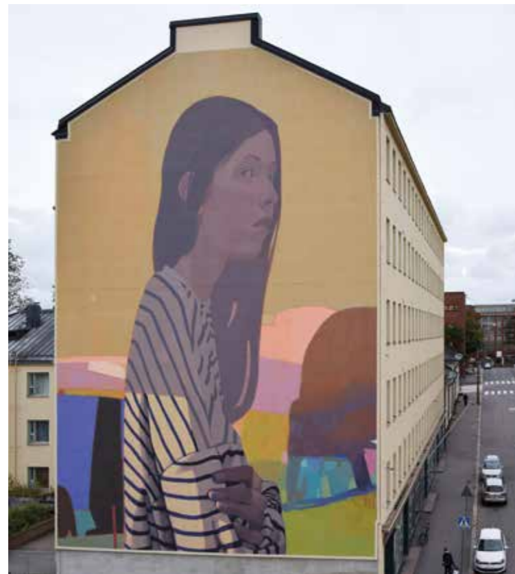
Polka - Helsinki - Finlande - 2018 ©

Après plusieurs années passionnantes avec Bezt, Sainer décide de se concentrer de plus en plus sur son propre travail et a inauguré sa première exposition personnelle en 2013. Grâce à une approche picturale combinant un certain réalisme avec des techniques d'illustration et de peinture classique qui plonge le spectateur dans son propre monde, il aime affronter la tradition et la modernité. Sainer donne vie à des tableaux intemporels autour de personnages qu'il met en scène dans des situations extravagantes. Ce passage du réel au surréel se produit souvent sous la lumière de clair-obscur profonds que Sainer crée au fur et à mesure qu'ils arrivent. Ses œuvres ont été exposées dans des galeries du monde entier, en Allemagne, en Autriche, en Italie et en Californie. Au fil des années, Sainer a rencontré un succès grandissant tant sur les murs que dans les galeries.