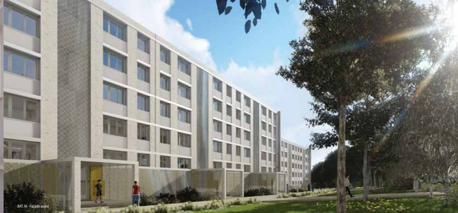
BAT. M - Façade avant