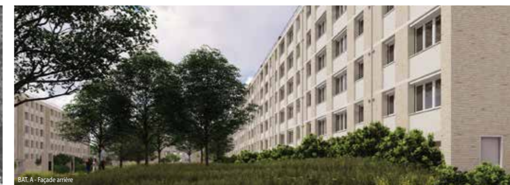
BAT. A - Façade arrière