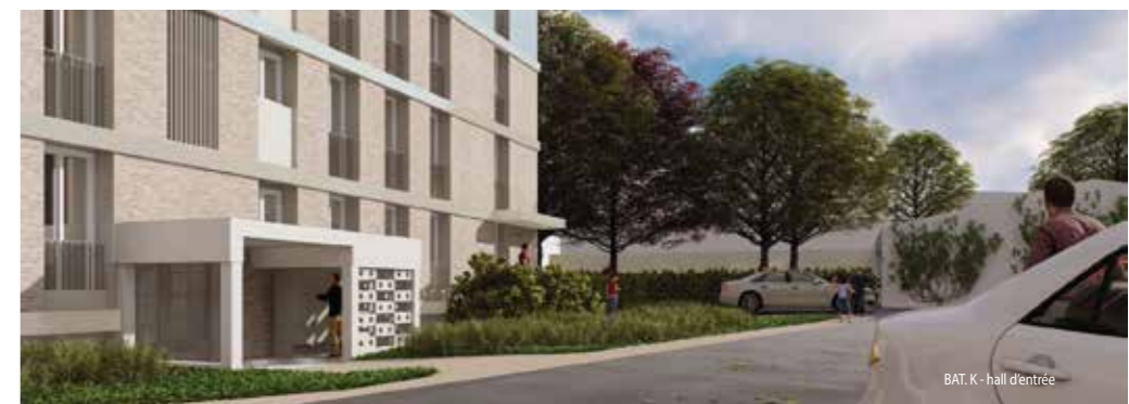
BAT. K - hall d'entrée