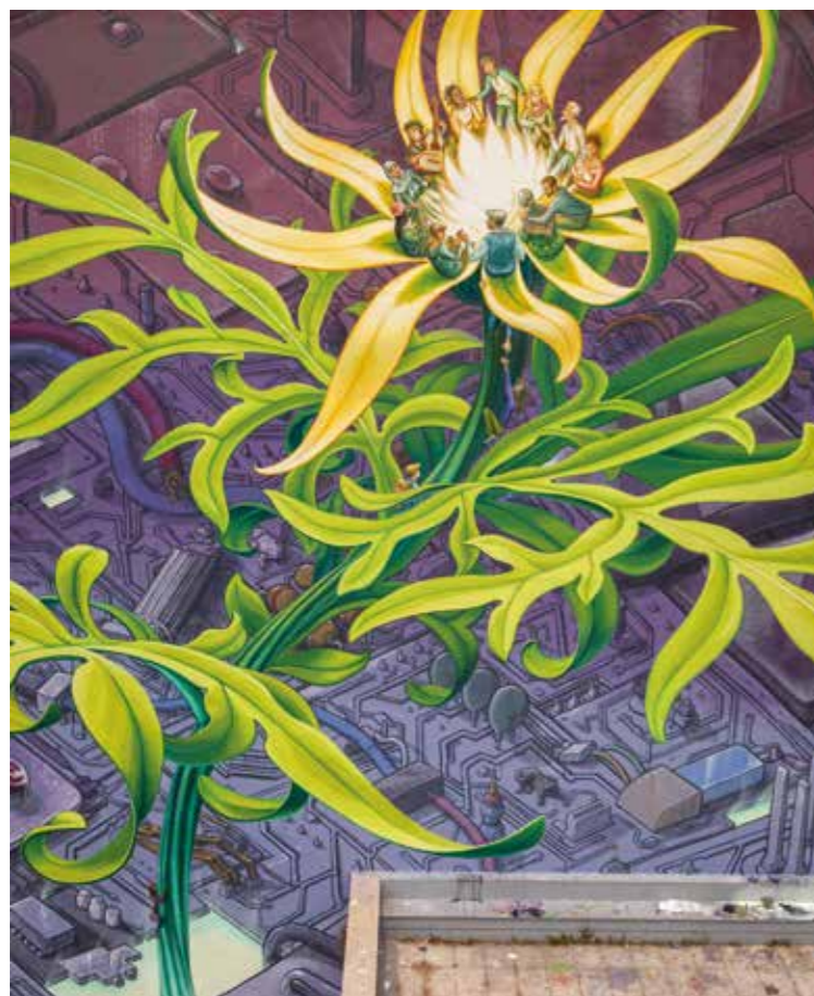
Une mauvaise herbe à São Paulo - São Paulo - Brésil - 2015 ©

Loin de l'architecture conventionnelle, Pastel conçoit son art de rue comme un travail d'acupuncture urbaine. Les villes modernes sont pleines de « non-lieux » en raison d'un urbanisme irrégulier et non inclusif. Le muralisme peut donc être un renouveau pour ces lieux, en travaillant sur l'identité locale et ne pas être un simple outil de gentrification sociale.