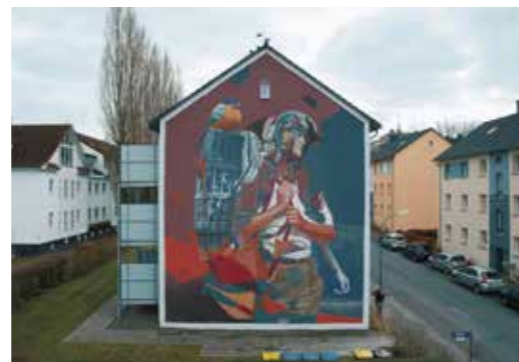
La différence de similarité - Allemagne ©