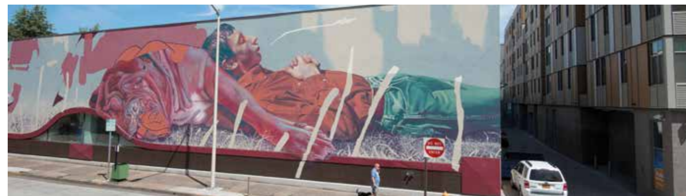
La torpeur canine de l'été - Etats-Unis - 2017 ©

Aryz est né en 1988 à Palo Alto. En 1991, ses parents déménagent pour Barcelone puis à Cardedeu où il réside. Ce jeune artiste n'est pas seulement un graffeur mais aussi un illustrateur et un peintre de talent. Ses immenses fresques ne laissent personne indifférent.