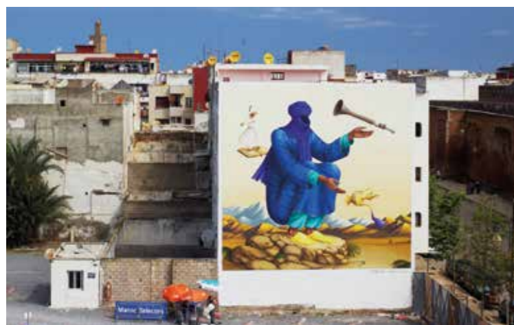
Magicien du Maghreb - Rabat - Maroc - 2016 ©

Waone est influencé par les illustrations des livres et des magazines soviétiques ainsi que par les muralistes latino-américain et le graffiti brésilien qui le conduiront à peindre des fresques murales. Il s'inspire également des livres d'enfants, des histoires populaires, des ouvrages scientifiques, des peintres animaliers, naturalistes et surréalistes, mais aussi des illustrateurs du 19e siècle, des gravures médiévales, de la religion et des traditions spirituelles. Fort de ses inspirations, il se tourne vers la rue comme espace d'expression et donne à voir une peinture que l'on qualifie de néo-surréaliste.