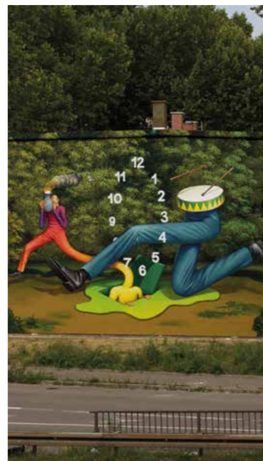
Saut à travers le temps - Mannheim - Allemagne - 2018 ©