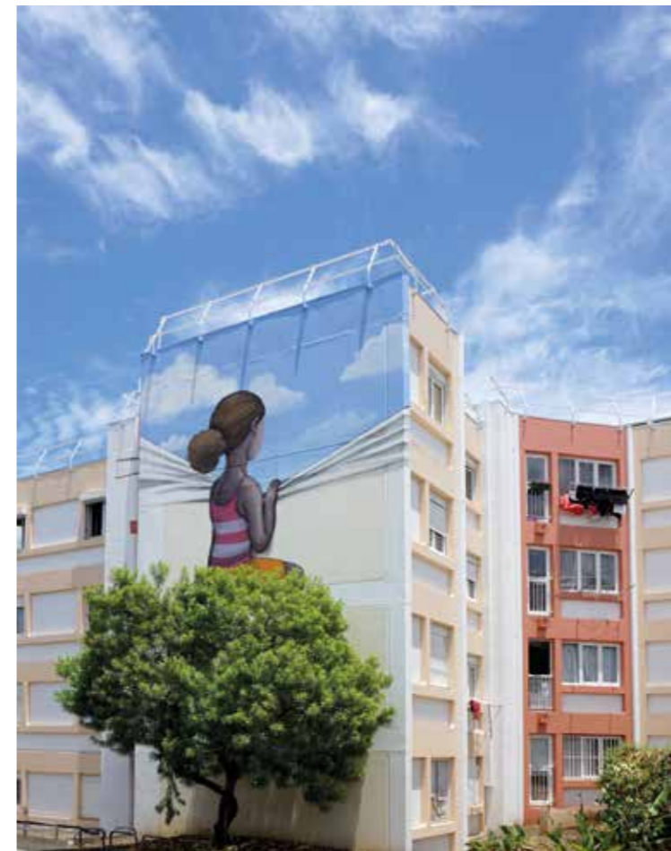
Dans le ciel - Le Port, La Réunion - France - 2015 ©

Une partie du succès de Globepainter est due à son travail avec la série documentaire Les Nouveaux Explorateurs, qui l'a amené aux quatre coins du monde pour s'inspirer et peindre. Seth essaie aussi d'impliquer la communauté locale de différentes manières. Une façon d'impliquer les habitants dans son art est de les photographier en posant à côté des fresques murales. Témoin des conséquences de la globalisation, il célèbre dans ses créations les traditions et crée ainsi une hybridité culturelle entre technique d'expression moderne et représentation traditionnelle. Qu'il s'agisse de collaboration avec des artistes urbains locaux ou qu'il apprenne des techniques traditionnelles auprès d'artisans, son approche a dans tous les cas pour but de susciter un dialogue artistique.