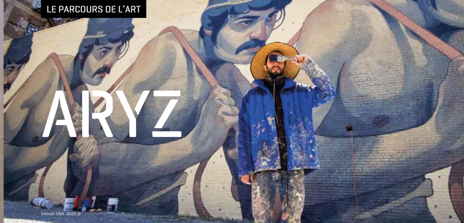
Detroit-USA - 2015 ©

Duo muraliste et créateur d'images provenant des Pays - Bas, Telmo Miel est la composition de Telmo Pieper et de Miel Krutzmann. Ils ont travaillé ensemble depuis leur rencontre à la Willem de Kooning Academy à Rotterdam en 2007, devenant officiellement Telmo Miel en 2012.