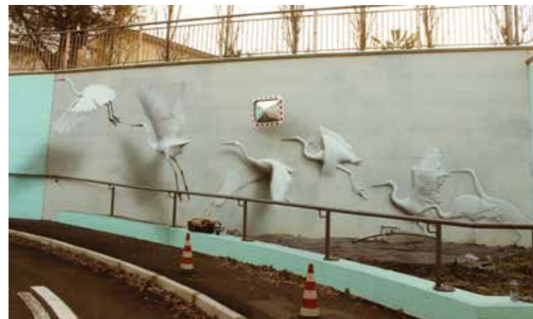
Béton vs béton - Riccione - Italie - 2015 ©

L'art d'Eron va au-delà de la simple représentation du sujet. Il est bien connu pour sa série de pièces qui montre des figures fantômes qui apparaissent sur les murs sous les événements d'échappement comme sa pièce de la série d'œuvres Soul of the Wall, située près de la Piazza del Popolo, dans la ville italienne d'Arezzo, en Toscane. L'œuvre d'art a été peinte sur le site où une bombe a détruit une grande partie du complexe militaire d'Arezzo pendant la Seconde Guerre mondiale.