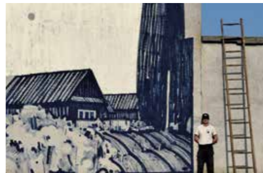
Male Chelmy - Pologne - 2018