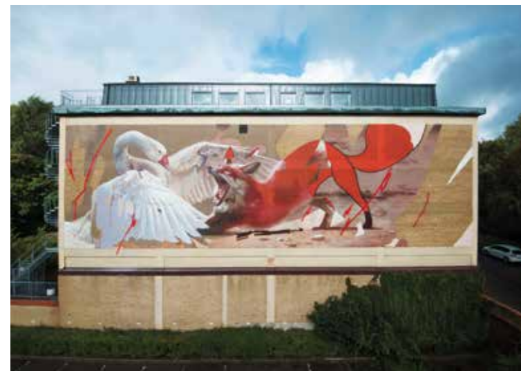
Les aventures de Nils Holgersson - Suède ©

Leurs peintures murales sont à la fois surréalistes et réalistes, avec une grande quantité de détails et de couleurs vibrantes. Capables de travailler de manière assez transparente, leurs styles se sont combinés à tel point qu'ils sont capables d'exécuter plusieurs domaines en tandem, d'échanger des lieux et de compléter le travail l'un de l'autre. Ils exécutent souvent leurs pièces d'une échelle monumentale, créant d'immenses tableaux de peinture d'une taille architecturale sur les façades de bâtiments. Combinant plusieurs éléments en une seule composition, ils superposent des références au monde humain et animal pour créer des créatures complexes et des scénarios fantastiques. Avec positivité, humour et une touche de romantisme, leur travail est saisissant et épique.