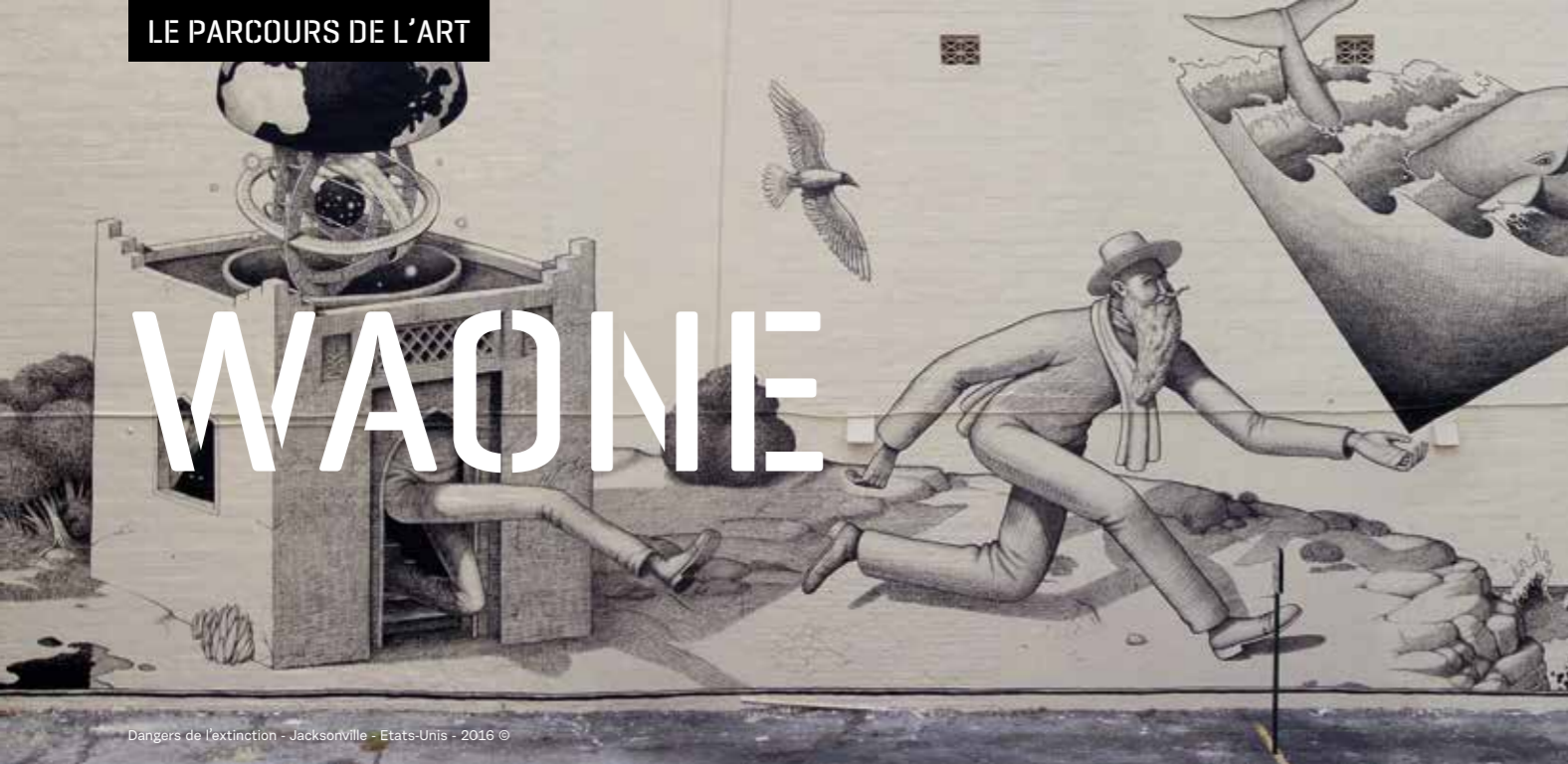
Dangers de l'extinction - Jacksonville - Etats-Unis - 2016