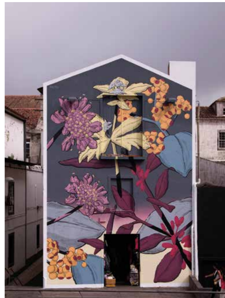
Endémisme vasculaire - Açores - Portugal - 2016 ©