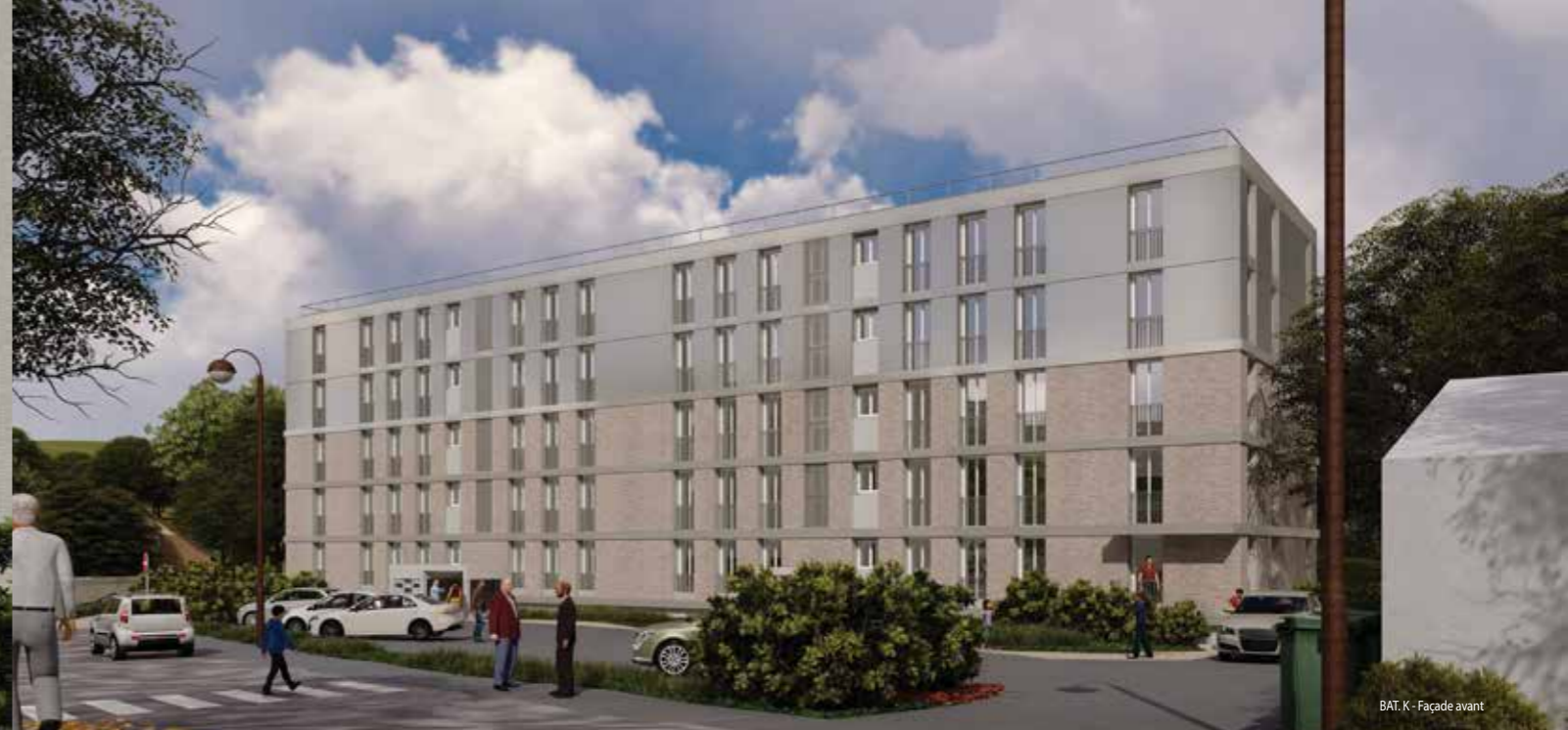
BAT. K - Façade avant