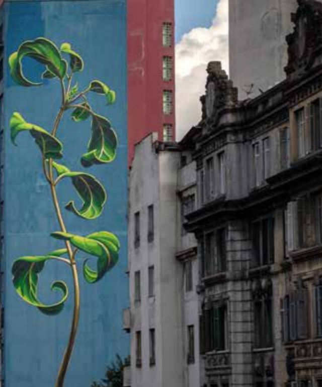
Une mauvaise herbe à São Paulo-São Paulo - Brésil - 2015 ©