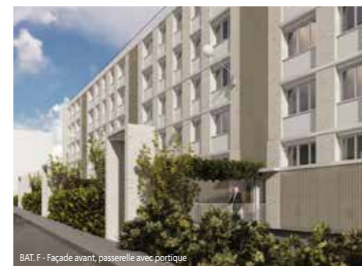
BAT. F - Façade avant, passerelle avec portique