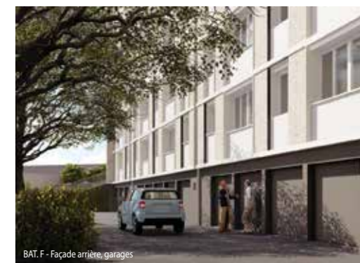
BAT. F - Façade arrière, garages