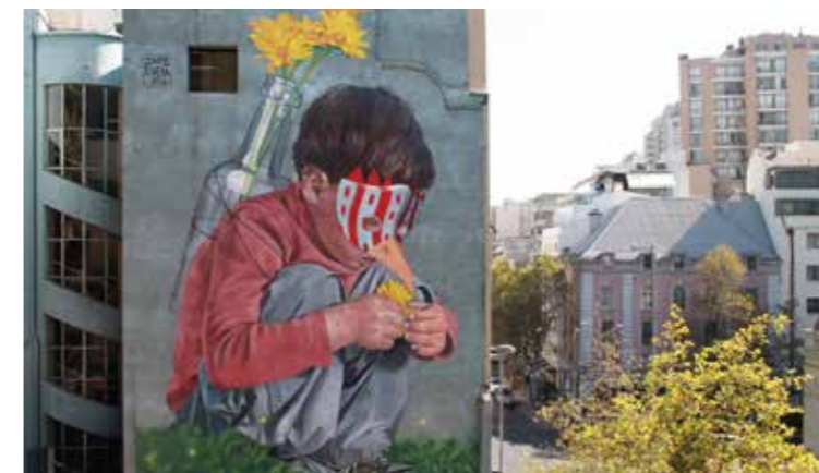
À la recherche de la vérité - Santiago - Chili - 2018