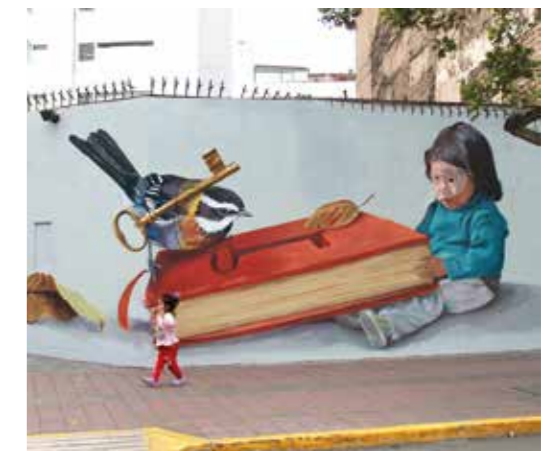
La clé - Lima - Pérou - 2018 ©