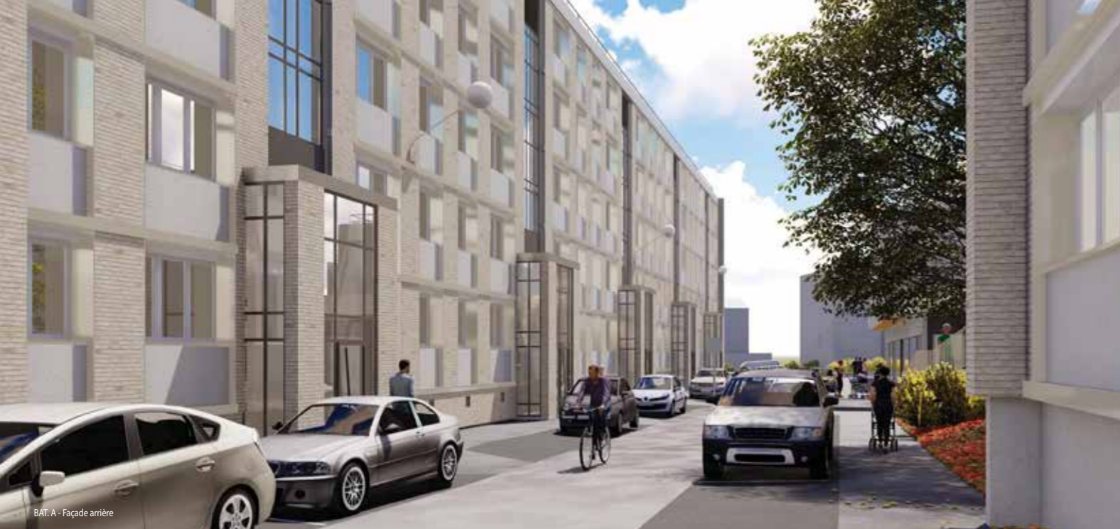
BAT. A - Façade arrière