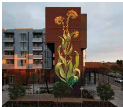
Prenant racine - Union City - USA - 2013