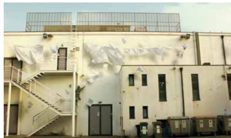
Giuliana - Santarcangelo di Romagna - Italie - 2016