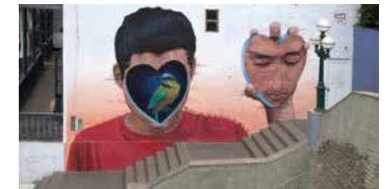
La maison d'un soupir - Lima - Pérou - 2015 ©